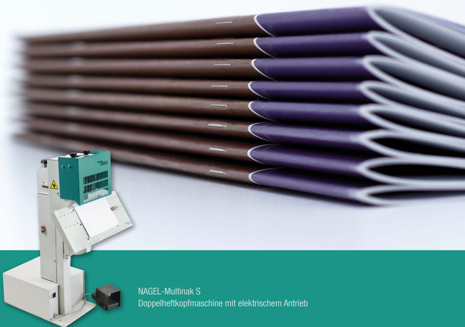
NAGEL-Multinak S Doppelheftkopfmaschine mit elektrischem Antrieb