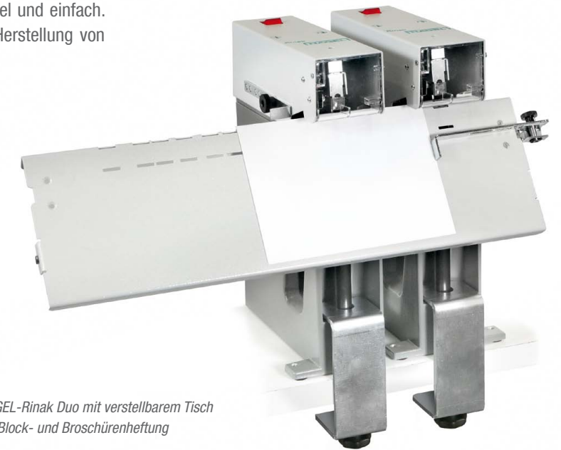
NAGEL-Rinak Duo mit verstellbarem Tisch für Block- und Broschürenheftung

Für alle Anwender, die die Unterlagen in nur einem einzigen Arbeitsgang mit zwei Klammern heften möchten, ist der Elektrohefter Rinak Duo besonders geeignet. Er besteht aus zwei Rinak-Einzelheftern, welche elektrisch gekoppelt sind und in variablem Abstand eingestellt werden können. Die Bedienung ist äußerst komfortabel und einfach. Dasselbe gilt für das Heften mit Ringklammern zur Herstellung von Broschüren, die in Ordnern ablegbar sein sollen.