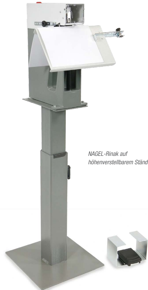
NAGEL-Rinak auf höhenverstellbarem Ständer