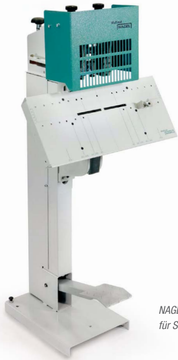
NAGEL-Multinak FS mit Fußbetrieb für Sattelheftung

Die Multinak Doppelheftkopfmaschinen sind besonders wirtschaftlich bei häufig wechselnden Auflagen von Blocks und Broschüren. Aufgrund ihrer Vielseitigkeit und Langlebigkeit gehören sie zur Grundausstattung im grafischen Betrieb. Der Antrieb der Multinak FS erfolgt über ein Fußpedal, das sich leichtgängig bedienen lässt.