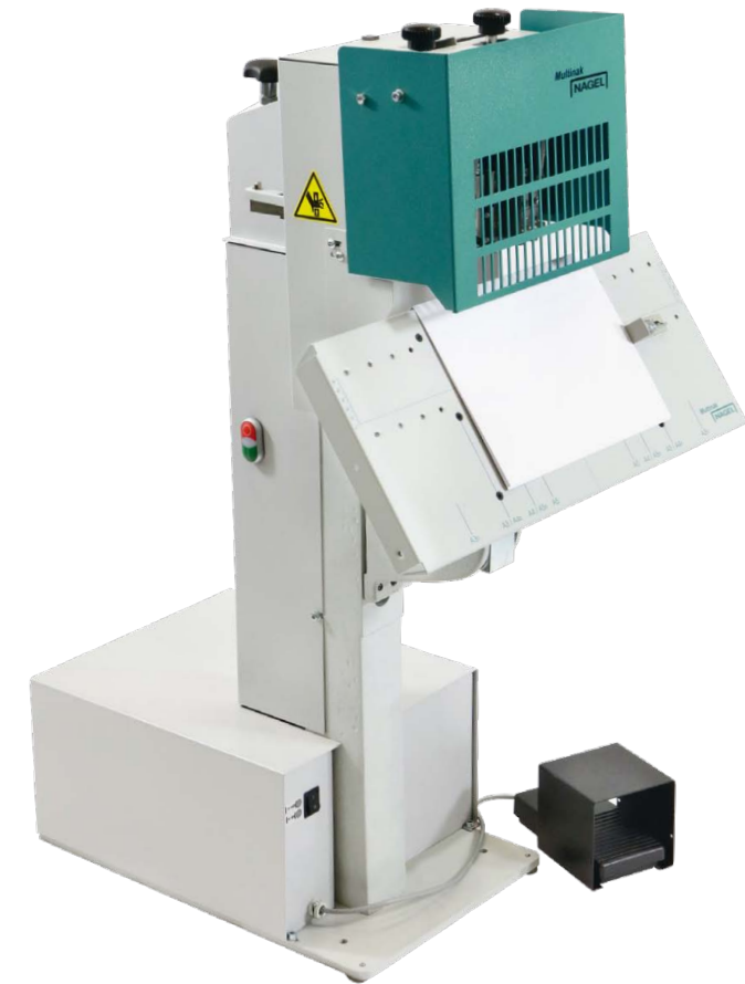
NAGEL-Multinak S mit verstellbarem Tisch für Block- und Broschürenheftung

Alle Verschleißteile sind vom Anwender leicht auswechselbar – ein Kundendienstesatz ist nicht erforderlich.