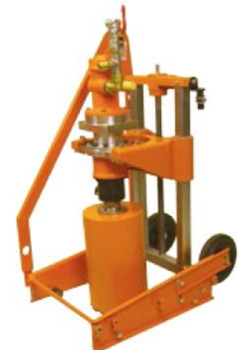
Пневматический двигатель LZL15 Технические данные см.стр.25