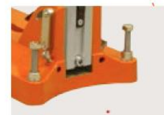
Вкл. лазерный принтер!