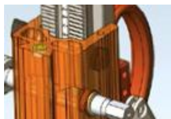
Высококачественная скользящая направляющая