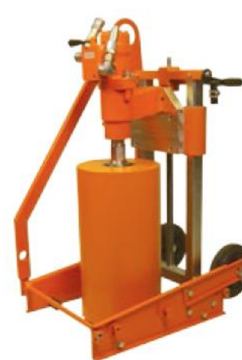
Гидравлический двигатель HBM100 Технические данные см.стр.25

Установка для сверления каналов на выбор поставляется в комплекте с гидравлическим, пневматическим или электрическим двигателем.