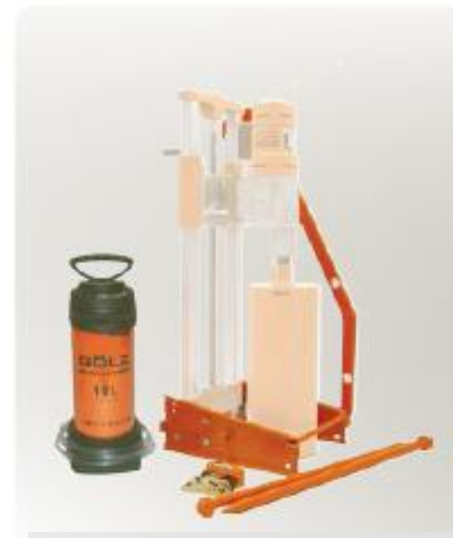
Комплект для переоборудования канала Простое позиционирование и закрепление в области каналостроения