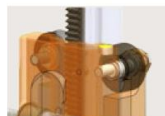
Высококачественная роликовая направляющая