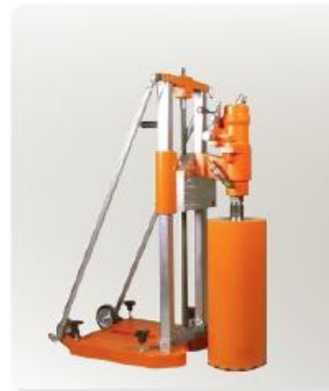
КВ150 с гидравлическим двигателем 140 бар, 300 мин. 1 (НВМ100)