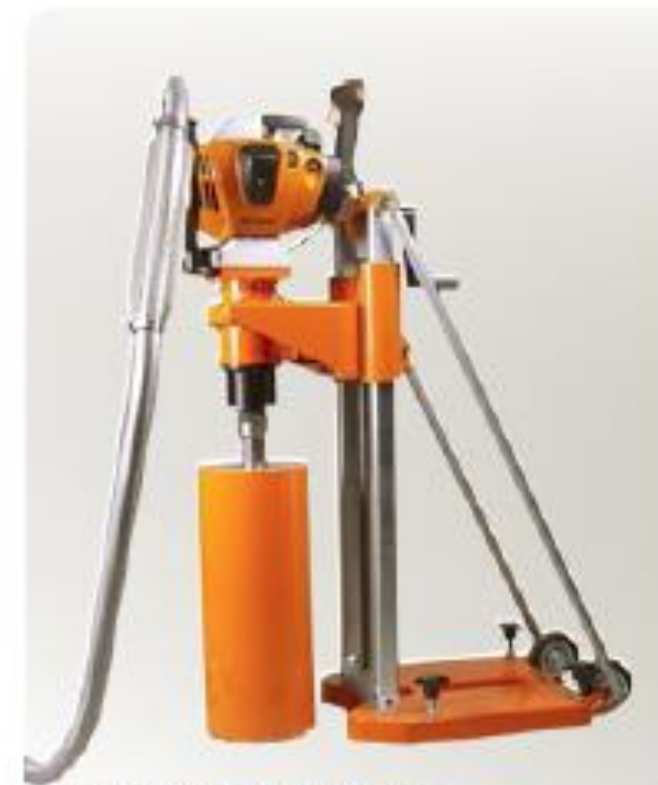
КВ150 с бензиновым приводом STIHL 2,8 кВт (3,8 ЛС) 300 мин. 1