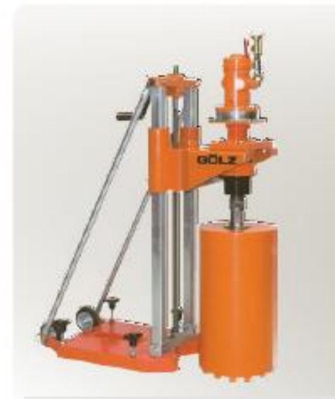
КВ150 с пневмодвигателем 6-7 бар, 280/600 мин. 1